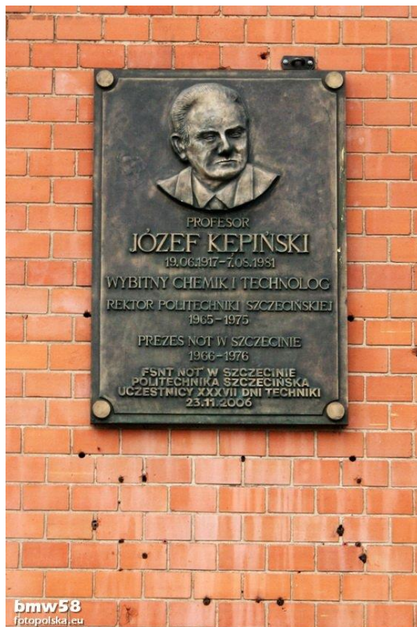
Tablica poświęcona Józefowi Kepińskiemu , gmach dawnego Wydziału Chemicznego PS;