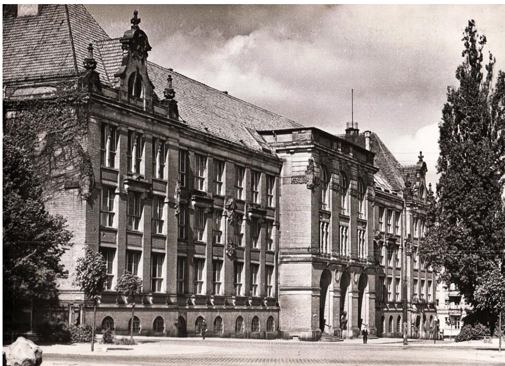
Gmach dawnego Wydziału Chemicznego Politechniki Szczecińskiej (dziś Zachodniopomorski Uniwersytet Techniczny);