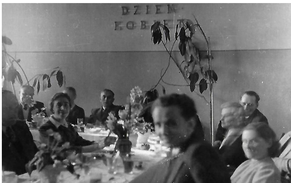
Uroczyste spotkanie z okazji Dnia Kobiet;